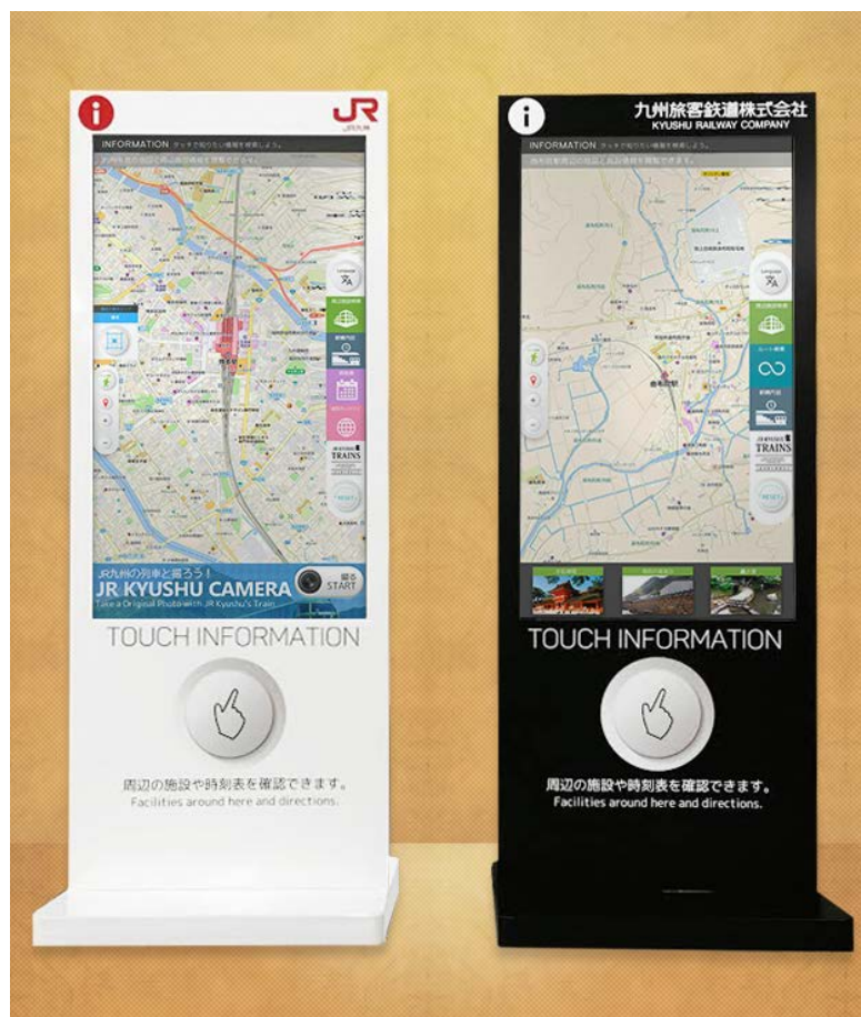
自立式 55 インチタッチ式デジタルサイネージ 左：博多駅設置用 右：由布院駅設置用

株式会社ゼンリンデータコムの子会社でデジタルサイネージ事業を手掛ける株式会社 Will Smart（ウィルスマート 本社：東京都港区、代表取締役社長：和田幸平 以下「Will Smart」）と、九州旅客鉄道株式会社（本社：福岡市博多区、代表取締役社長：青柳俊彦 以下「JR九州」）は、近年急増する訪日外国人観光客等を中心とした駅利用者の利便性向上を目的に、デジタルサイネージを用いた多言語情報等の提供の実証実験を2015年8月4日（火）より実施します。