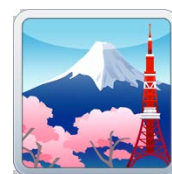
Photo Japan Guide アプリアイコンイメージ