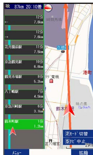
電車+徒歩のルート