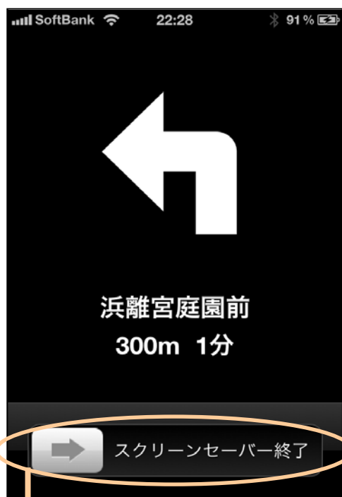
通常のナビモード画面