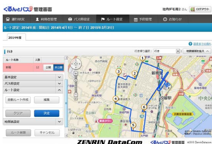
管理者 PC 用画面