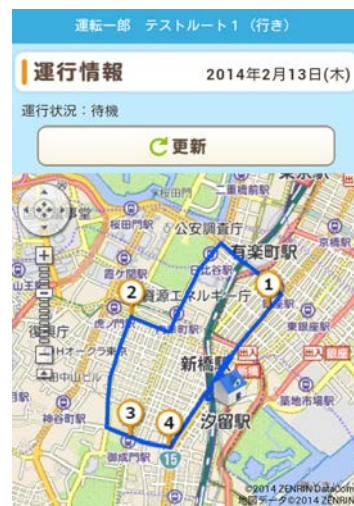
ユーザーサイト画面