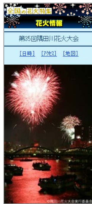
スポット詳細ページ