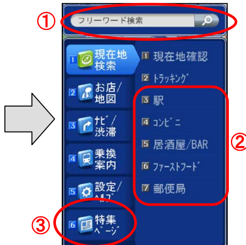
【新 TOP 画面】