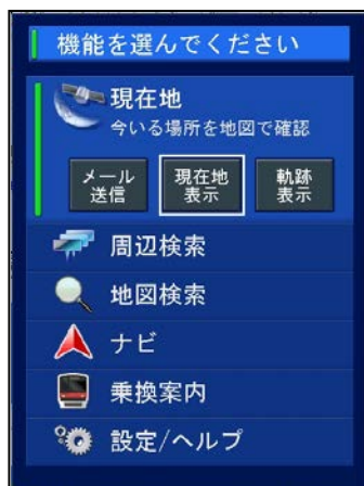
【旧 TOP 画面】